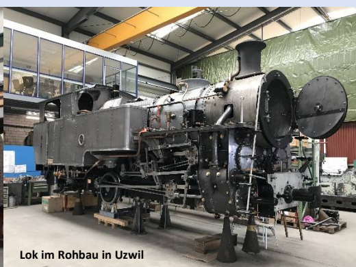
Lok im Rohbau in Uzwil