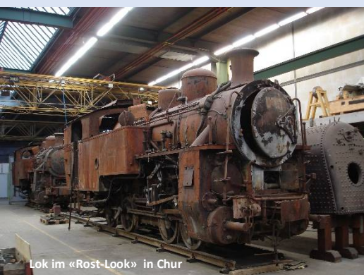
Lok im «Rost-Look» in Chur

Lassen Sie sich diese Gelegenheit nicht entgehen. Wir freuen uns auf Ihren Besuch!